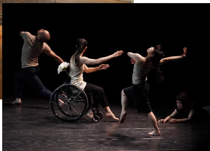
2018年公演作品「エクキュクレマ」より