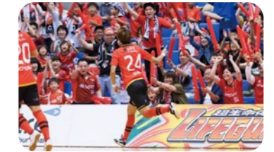
バルドラール浦安プリメーロ