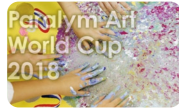
アートイベントの開催