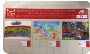
協賛企業主催アートコンペの開催