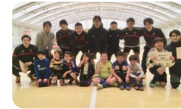
バルドラール浦安デフィオ チャレンジフットサル教室