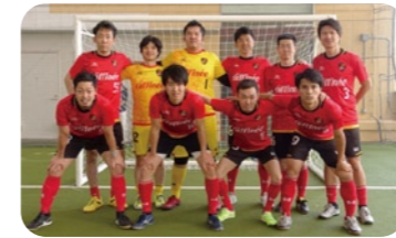
バルドラール浦安デフィオ

バルドラール浦安は、Fリーグ(日本フットサルリーグ http://www.fleagu.jp )に所属するトップチームをはじめとして6つのカテゴリーのチームを運営しています。 中でも、日本では唯一となる“ろう者(聴覚障がい者)”による競技フットサルチームを運営するなど、障がい者スポーツへの取り組みを継続して実施してきました。 トップアスリートから障がい者アスリートまで、フットサルを中心にアスリートを育成しています。