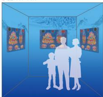
青（水色+グラデーション）