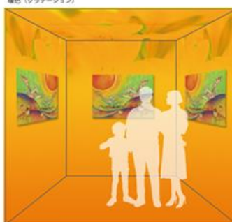
暖色（グラデーション）